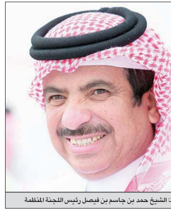
الشيخ حمد بن جاسم بن فيصل رئيس اللجنة المنظمة